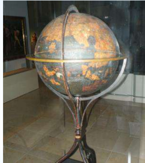
Глобус М. Бехайма