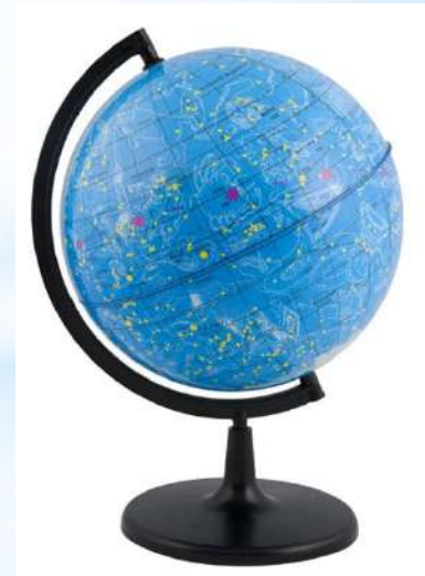
Глобус звёздного неба